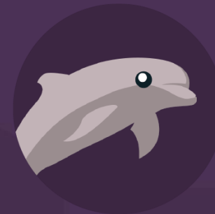
De Vorba cu Delfinii