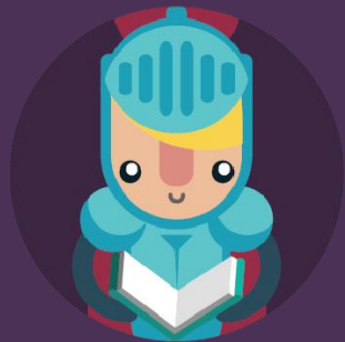
Seara de Poveste