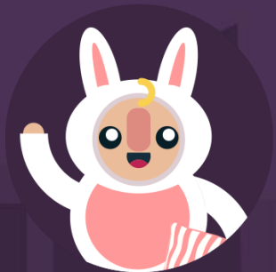
Pui de Perna pentru Pui de Om