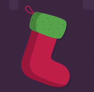
Ciorapelul cu Bomboane