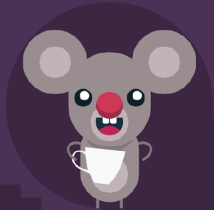
Canuta cu Bomboane