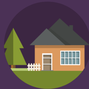
Excursie la Casa Vlasia