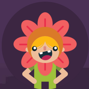
Socioterapie prin teatru