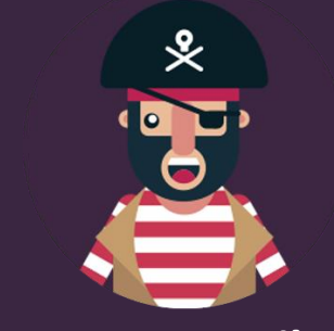
Luna Povestilor in Spitale