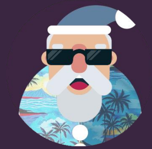
Mos Craciun de Vara