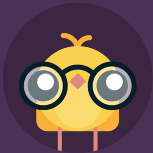
Impreuna vedem viata mai frumoasa