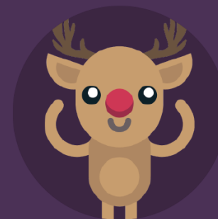
Carnavalul Bradului de Craciun